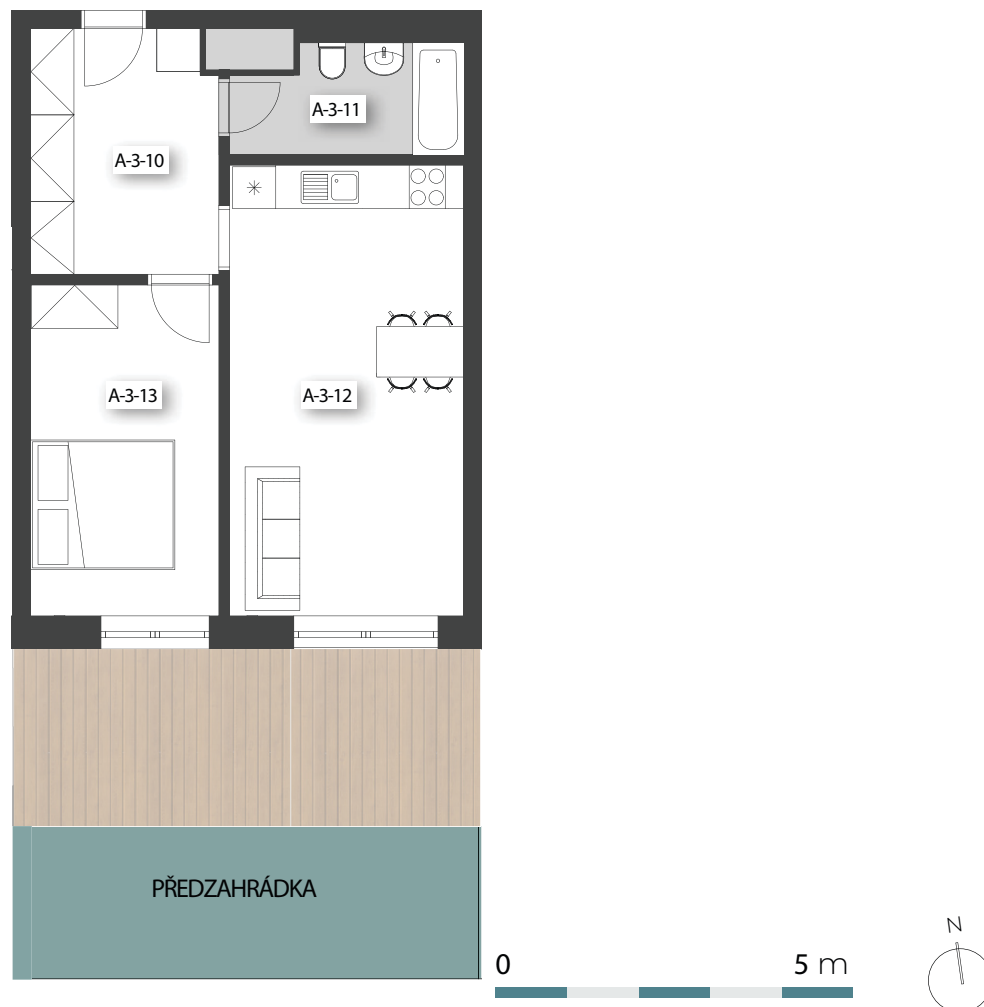
Schéma půdorysu představuje dispoziční řešení. Vybavení kuchyňskou linkou, vestavěnými skříněmi, nábytkem apod. není předmětem prodeje. Plochy jednotlivých místností jsou orientační. Developer si vyhrazuje právo na změnu.

*Podlahová plocha je vypočtena podle nařízení vlády č. 366/2013 Sb. jako půdorysná plocha ohraničená vnitřními stranami obvodových zdí bytu včetně půdorysné plochy všech svislých nosných i nenosných konstrukcí uvnitř bytu. Nezahrnuje balkony, lodžie, terasy, předzahrádky a jiné zpevněné plochy.